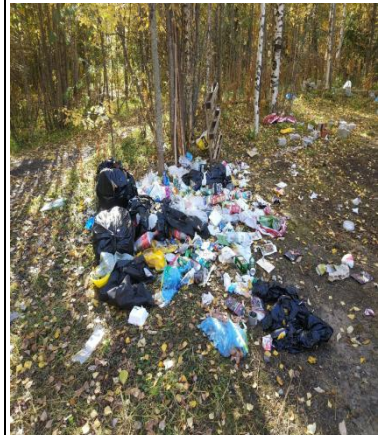
Приморский район, п. Катудино