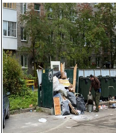
Дзержинского просп., 105/4