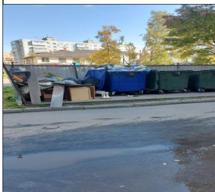
г. Архангельск, пр. Троицкий, 102