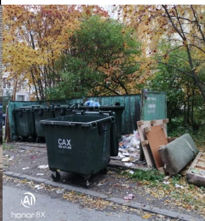
г. Архангельск, просп. Троицкий, 23