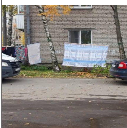
г. Архангельск, ул. Почтовый тракт, д. 17