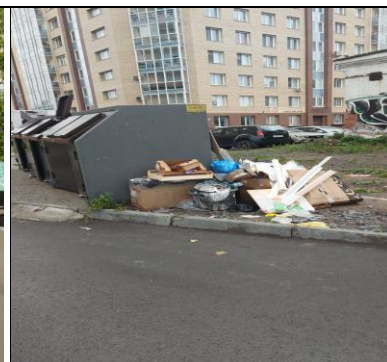
г. Архангельск, ул. Выучейского, 16