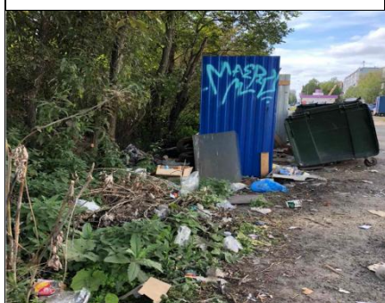
г. Архангельск, ул. Логинова, д. 72