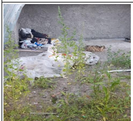
г. Архангельск, ул. Выучейского, 47/1