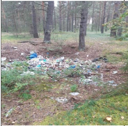
Вельский район, д. Филяевская