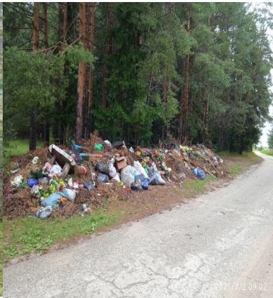
Приморский район, п. Катудино