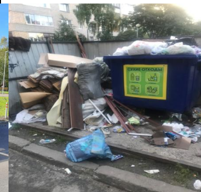
г. Архангельск, Троицкий просп., д. 104