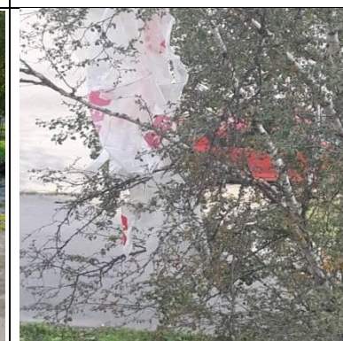
г. Архангельск, ул. Выучейского, 47/1