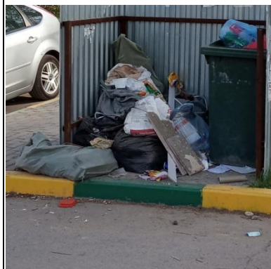
г. Архангельск, Терехина пл., 6