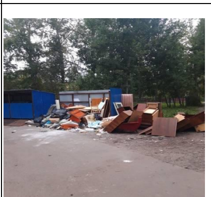
г. Архангельск, ул. Воскресенская, 105/3