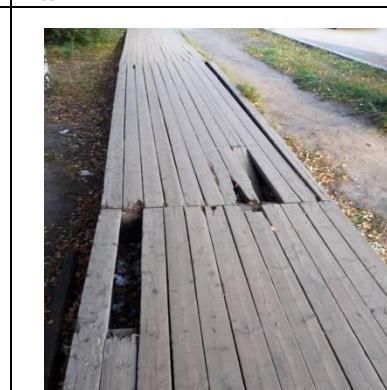
г. Архангельск, Воскресенская- Обводный канал