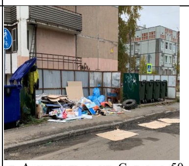
г. Архангельск, ул. Садовая, 50