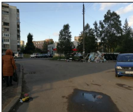
г. Архангельск, Воскресенская, 91