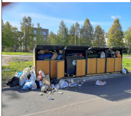
г. Архангельск, ул. 23 Гв. Дивизии