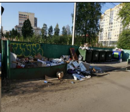
г. Архангельск, ул. Воскресенская, 7