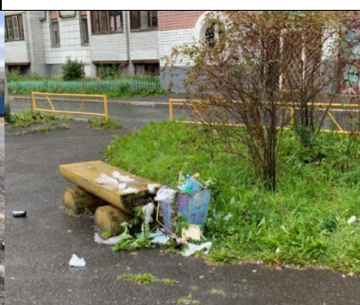
г. Архангельск, ул. Суфтина, д. 32