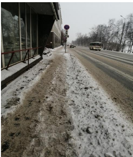
г. Архангельск, Наб. Сев. Двины, д. 12, тротуар