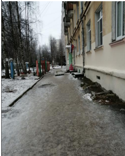
г. Архангельск, просп. Троицкий, д. 46/1, наледь на тротуаре