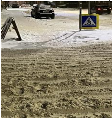
г. Архангельск, ул. Володарского и просп. Сов. Космонавтов, пешеходный переход