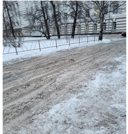
г. Архангельск, просп. Троицкий, 94