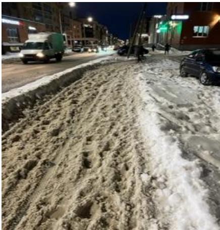
г. Архангельск, ул. Поморская, тротуар