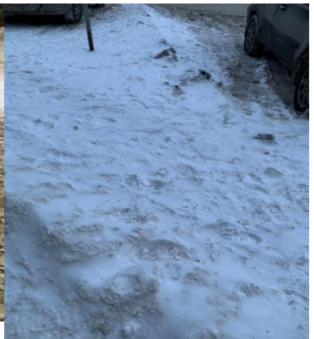
г. Архангельск, ул. Логинова, д. 7, тротуар