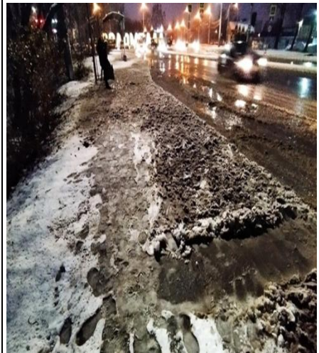
г. Архангельск, остановка общественного транспорта, район Соломбала