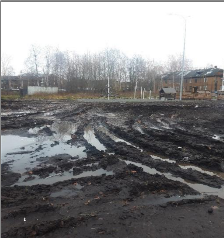
г. Архангельск, ул. Выучейского, д. 47/1, придомовая территория