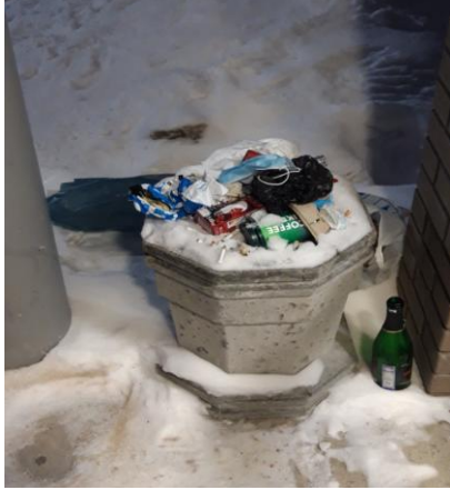
г. Архангельск, ул. Выучейского., д. 47/1