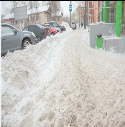
г. Архангельск, пр. Ломоносова, д. 181