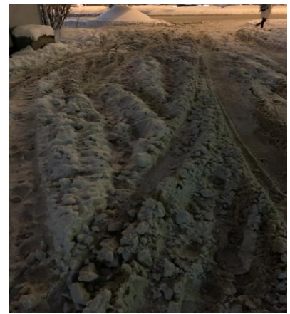
г. Архангельск, ул. Гагарина, д. 9