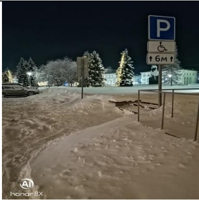
г. Архангельск, пл. Ленина