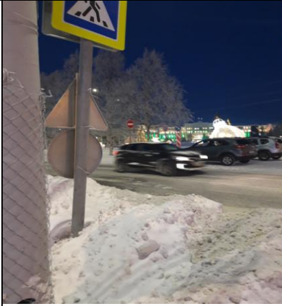
г. Архангельск, пл. Ленина