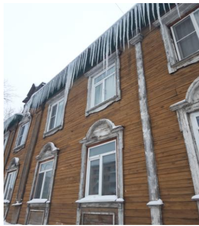
г. Архангельск, ул. Выучейского, д. 66