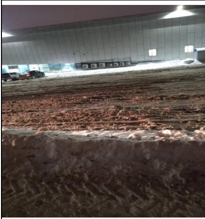
г. Архангельск, МРВ